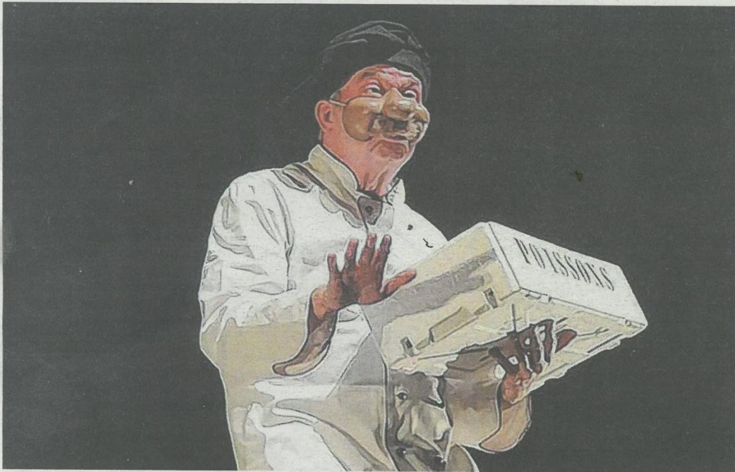
500 écoliers de Soissons et communes alentours ont assisté au spectacle joué au Mail.

SOISSONNAIS Des écoliers de Soissons et alentours ont assisté à une représentation d'un conte philosophique de Dumas. Une bonne introduction à la philosophie pour ces jeunes.